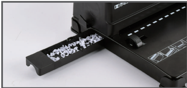
7. 제본 후에는 좌측의 파지함을 꼭 비워주세요.