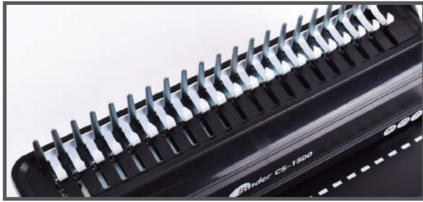
4. 천공 후 거치대에 링을 걸고 핸들을 뒤로 밀어 링을 벌려줍니다.