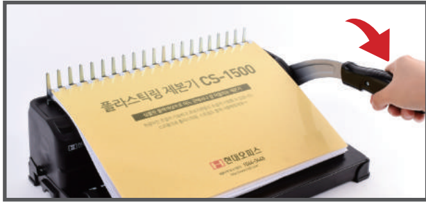
5. 링이 벌어진 곳에 천공된 원고를 끼운 후 핸들을 앞으로 당겨 링을 닫아줍니다.