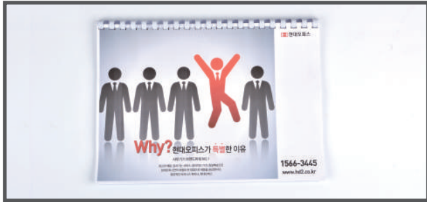
6. 제본 완성!