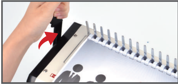
5. 링이 벌어진 곳에 천공된 원고를 끼운 후 핸들을 뒤로 밀어 링을 닫아줍니다.