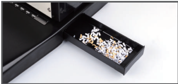
7. 제본 후에는 우측의 파지함을 꼭 비워주세요.