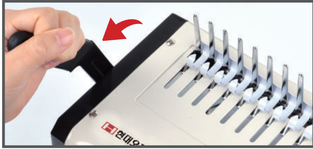
4. 천공 후 거치대에 링을 걸고 핸들을 앞으로 당겨 링을 벌려줍니다.