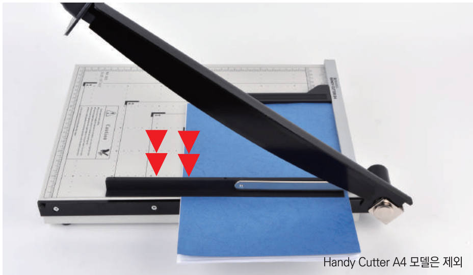
Handy Cutter A4 모델은 제외

재단손잡이를 내리면 자동으로 칼날과 같이 내려와 원고를 고정시켜 원고밀림을 방지합니다.