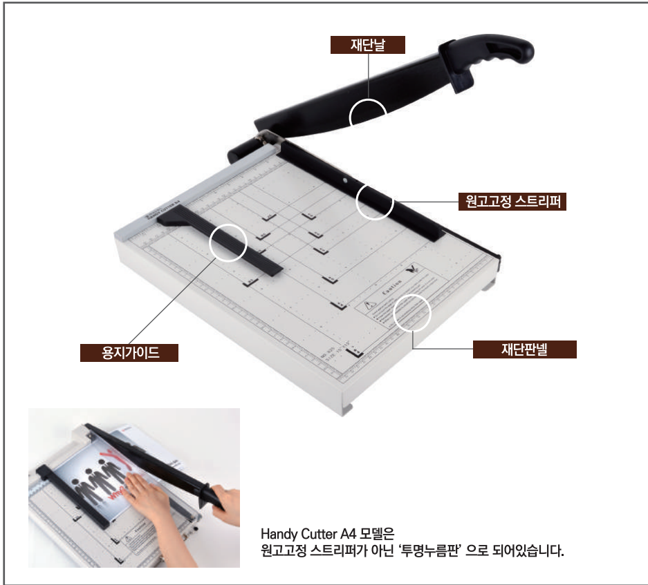
Handy Cutter A4 모델은 원고고정 스트리퍼가 아닌 '투명누름판'으로 되어있습니다.