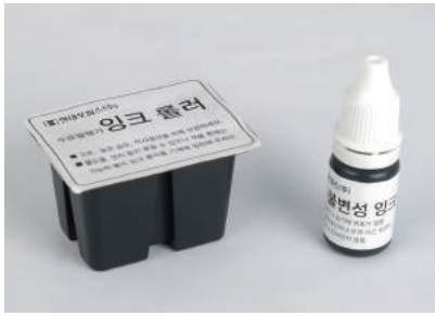
▶ 잉크롤러와 잉크