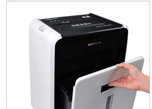
1. 파지함을 꺼내주세요.

역회전 기능 역회전 버튼을 누르면 세단중인 용지를 되돌려 빼낼 수 있습니다.