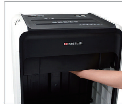
2. 파지함이 있던 안쪽 윗부분에 양 손바닥을 놓고 힘을 주어 왼쪽으로 세게 밀어줍니다.