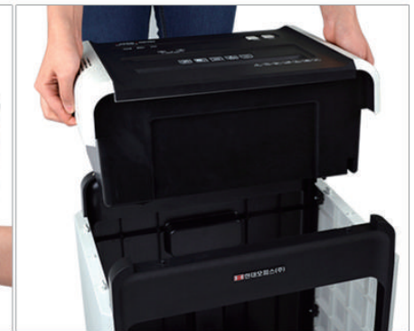
3. 세단기의 헤드와 몸통이 분리된 모습입니다.