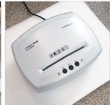
⑤ 분리된 헤드만 따로 포장해서서 보내주시면 됩니다.