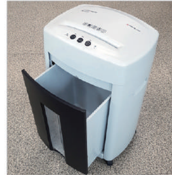
① 기기 파지함을 분리해 줍니다.