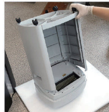
④ 위 사진과 같이 헤드를 분리해줍니다.