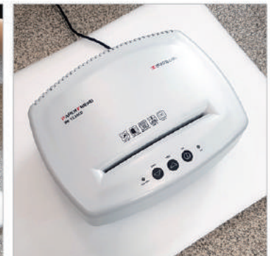
⑤ 분리된 헤드만 따로 포장하셔서 보내주시면 됩니다.