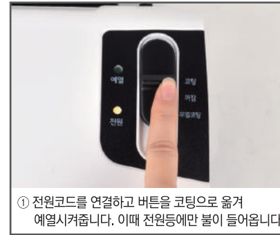
① 전원코드를 연결하고 버튼을 코팅으로 옮겨 예열시켜줍니다. 이때 전원등에만 불이 들어옵니다.