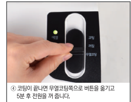
④ 코팅이 끝나면 무열코팅쪽으로 버튼을 옮기고 5분 후 전원을 꺼 줍니다.