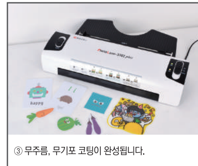
③ 무주름, 무기포 코팅이 완성됩니다.