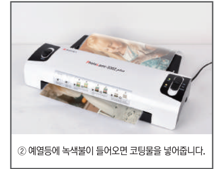
② 예열등에 녹색불이 들어오면 코팅물을 넣어줍니다.