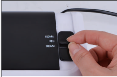
① 코팅할 원고에 맞게 온도를 설정합니다.