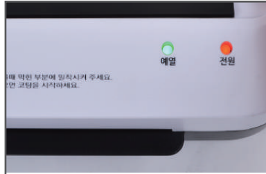
② 예열이 완료되면 예열등에 녹색불이 들어옵니다.