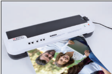
③ 코팅할 원고를 투입구에 넣어주세요.