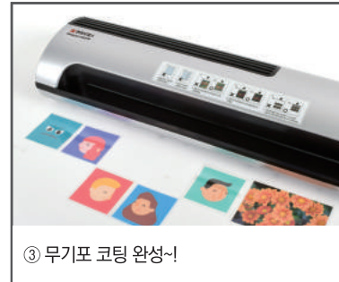
③ 무기포 코팅 완성!