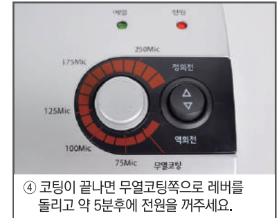
④ 코팅이 끝나면 무열코팅쪽으로 레버를 돌리고 약 5분후에 전원을 꺼주세요.