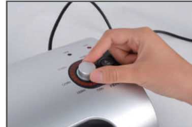
① 전원 스위치를 켜고, 코팅두께에 따른 온도를 조절해줍니다.