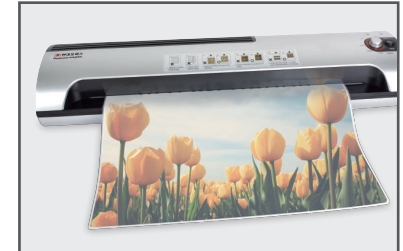
② 예열등에 녹색불이 들어오면 코팅물을 넣어줍니다.