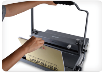
④ 링을 걸어준 원고를 제본틀 안에 넣고 핸들을 뒤로 밀어 압착해주면 제본완성~!