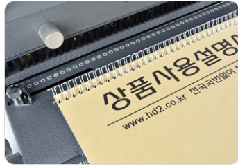
② 와이어링에 천공한 원고를 넣어줍니다.