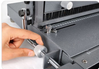
③ 와이어규격 맞춤핸들을 이용하여 와이어 사이즈를 맞춰줍니다.