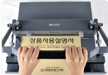
① 천공핸들을 앞으로 당겨 천공해줍니다.