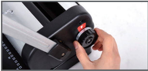
5. 제본할 링 사이즈에 맞춰 링규격 조절레버를 조절합니다.