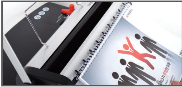
4. 링 거치대에 링을 걸고 천공된 종이를 걸어줍니다.