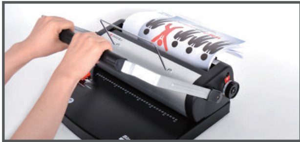
6. 와이어 압착홈에 링을 끼운 원고를 아래로 향하게 넣고 핸들을 내려 와이어를 압착하면 제본이 완성됩니다.