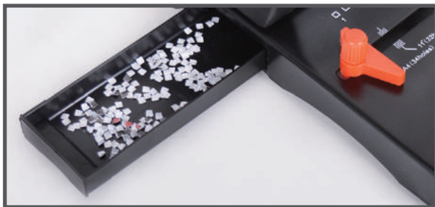
7. 제본이 끝나면 기기좌측의 파지함을 비워주세요.