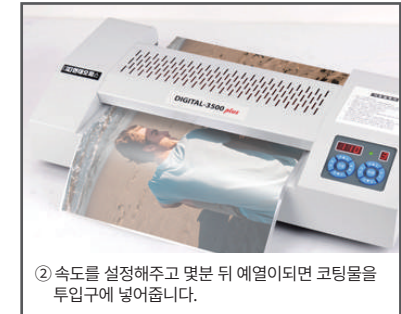
② 속도를 설정해주고 몇분 뒤 예열이되면 코팅물을 투입구에 넣어줍니다.