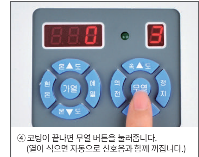
④ 코팅이 끝나면 무열 버튼을 눌러줍니다. (열이 식으면 자동으로 신호음과 함께 꺼집니다.)