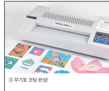
③ 무기포 코팅 완성!