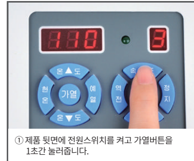
① 제품 뒷면에 전원스위치를 켜고 가열버튼을 1초간 눌러줍니다.