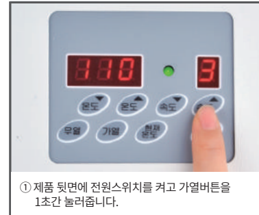
① 제품 뒷면에 전원스위치를 켜고 가열버튼을 1초간 눌러줍니다.