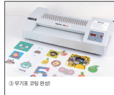
③ 무기포 코팅 완성!