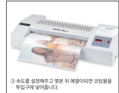
② 속도를 설정해주고 몇분 뒤 예열이되면 코팅물을 투입구에 넣어줍니다.