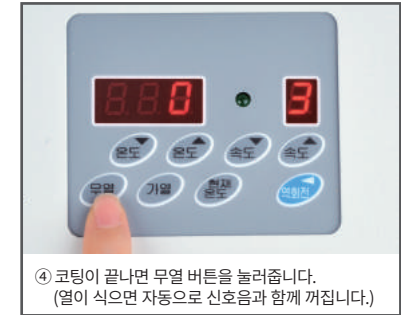
④ 코팅이 끝나면 무열 버튼을 눌러줍니다. (열이 식으면 자동으로 신호음과 함께 꺼집니다.)