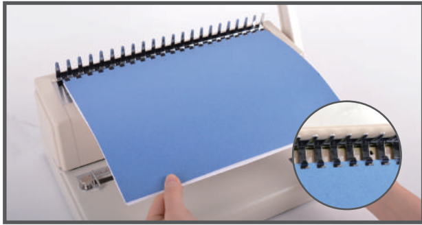
4. 벌어진 링에 천공된 원고를 걸어준 후 핸들을 당겨 링을 단아줍니다.