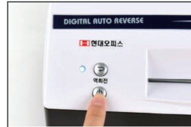
① 전원버튼을 눌러 전원을 켜 줍니다.