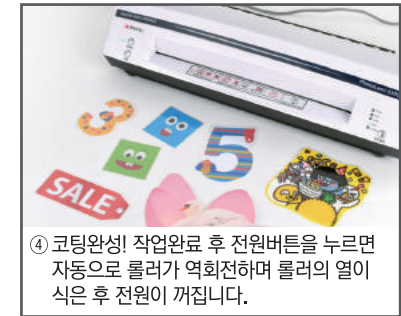
④ 코팅완성! 작업완료 후 전원버튼을 누르면 자동으로 롤러가 역회전하며 롤러의 열이 식은 후 전원이 꺼집니다.

*코팅이 완료되면 코팅기에서 코팅물을 제거해 주세요. 코팅물이 제거되지 않은 상태로 전원버튼을 누르면 롤러가 역회전하므로, 코팅물이 말려들어갈 수 있습니다.