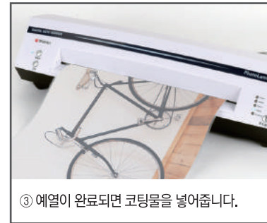
③ 예열이 완료되면 코팅물을 넣어줍니다.