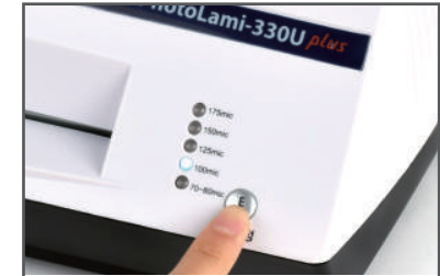
② 코팅지와 코팅할 원고에 맞게 온도를 조절해 줍니다.