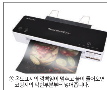
③ 온도표시의 깜빡임이 멈추고 불이 들어오면 코팅지의 막힌부분부터 넣어줍니다.