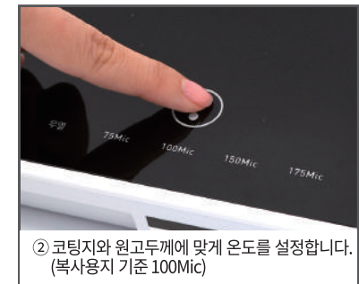
② 코팅지와 원고두께에 맞게 온도를 설정합니다. (복사용지 기준 100Mic)