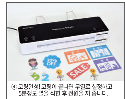
④ 코팅완성! 코팅이 끝나면 무열로 설정하고 5분정도 열을 식힌 후 전원을 꺼 줍니다.