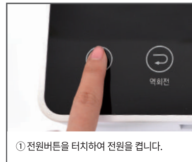
① 전원버튼을 터치하여 전원을 켭니다.