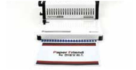
6. 제본 완성!