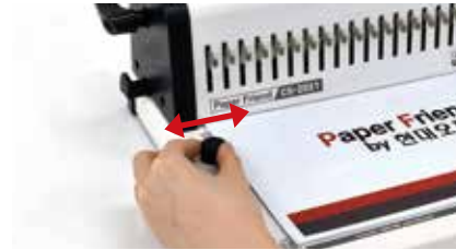
1. 제본할 서류를 준비한 후 제본할 용지에 맞게 용지 규격 조절 레버를 설정합니다.