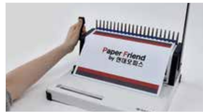
5. 벌어진 링에 천공된 원고를 끼운 후 제본 핸들을 뒤로 밀어 링을 닫아주세요.