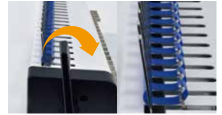
4. 천공 후 제본틀에 링을 걸고 제본 핸들을 앞으로 살짝 당겨 링을 벌려줍니다.