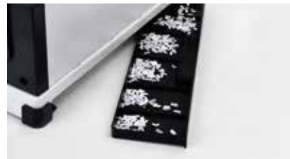
7. 제본 후에는 기기 뒷편의 파지함을 꼭 비워주세요.