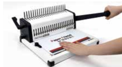
3. 천공할 용지를 용지 투입구에 넣고 천공 핸들을 내려 천공해 줍니다. (뚜꺼운 표지는 한 장씩 천공합니다.)