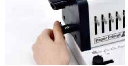
2. 좌측의 천공 마진 조절 레버를 원하는 위치로 설정해 줍니다. (레버를 바깥으로 당길수록 마진이 넓어집니다.)