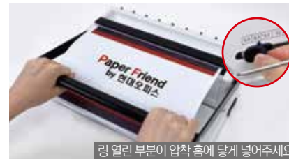
5. 링 사이즈에 맞춰 링규격을 조절한 후 제본할 문서를 와이어링 압착부에 넣고 핸들을 내려 링을 압착 시켜줍니다.