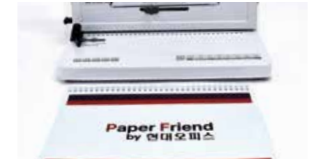
6. 제본 완성!