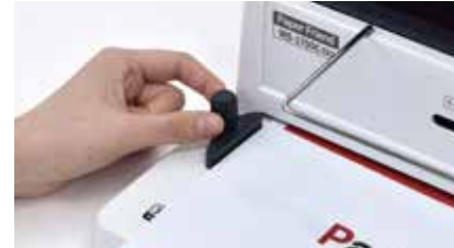
1. 제본할 서류를 준비한 후 제본할 용지에 맞게 용지 규격 레버를 설정합니다.