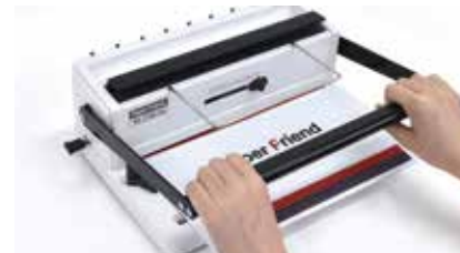
3. 천공할 용지를 넣고 핸들을 내려 천공해 줍니다.