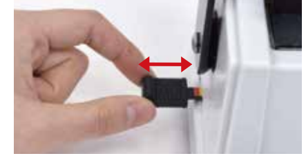
2. 좌측의 천공 마진 조절레버를 원하는 위치로 설정해 줍니다. (바깥으로 당길수록 천공 마진이 넓어집니다.)