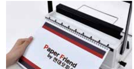
4. 링 거치대에 링을 걸고 천공된 종이를 걸어줍니다.