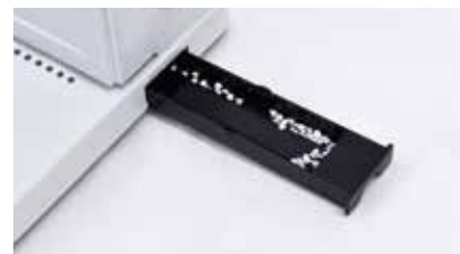
7. 제본 후에는 우측의 파지함을 꼭 비워주세요.