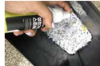
정전기방지 스프레이 100ml