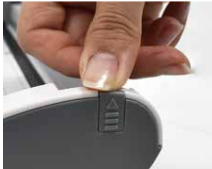
④ 커버를 다시 닫아줍니다.