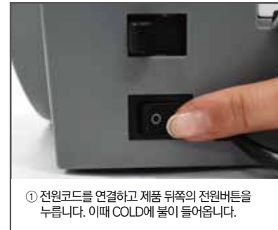
① 전원코드를 연결하고 제품 뒤쪽의 전원버튼을 누릅니다. 이때 COLD에 불이 들어옵니다.