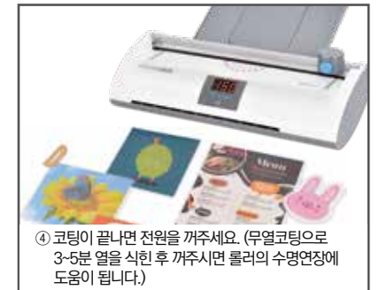
④ 코팅이 끝나면 전원을 꺼주세요. (무열코팅으로 3-5분 열을 식힌 후 꺼주시면 롤러의 수명연장에 도움이 됩니다.)