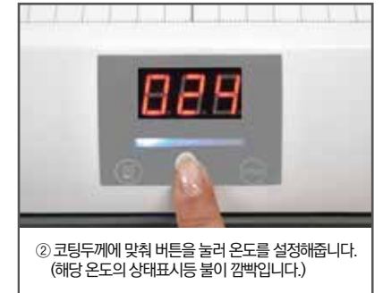
② 코팅두께에 맞춰 버튼을 눌러 온도를 설정해줍니다. (해당 온도의 상태표시등 불이 깜빡입니다.)