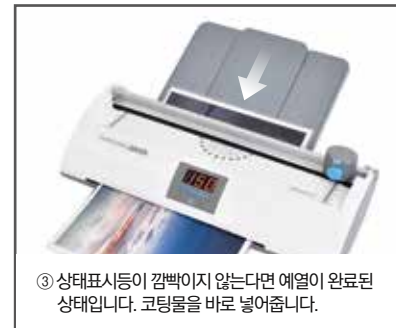
③ 상태표시등이 깜빡이지 않는다면 예열이 완료된 상태입니다. 코팅물을 바로 넣어줍니다.