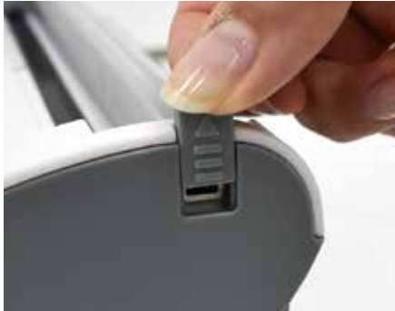
① 레일을 고정하고 있는 커버를 위로 올려 분리합니다.