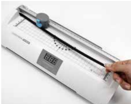
③ 기존 재단목을 들어서 빼고 새 재단목을 끼워줍니다.