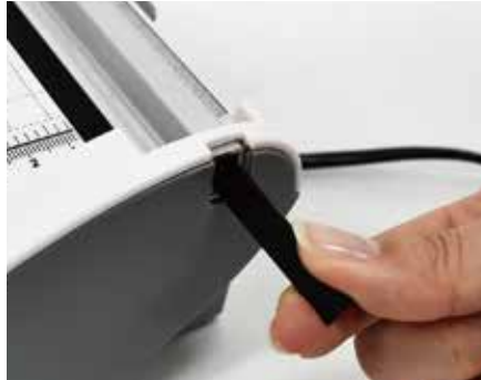
② 레일 안에 들어있는 여분의 재단목을 꺼내줍니다.