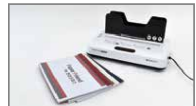
⑧ 제본 완성!