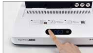
③ 제본 물 두께에 따라 제본 시간을 설정합니다. * 용지가 들어간 상태에서는 시간 설정 변경이 불가능합니다.

[시간 설정 권장] 18mm미만 : 60초 / 18~33mm : 120초 33~60mm : 180초