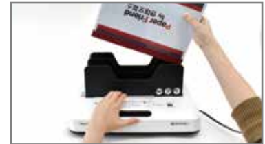
④ 바인딩 핸들을 당기고 준비했던 제본물을 넣고 압착을 하면 타이머 디스플레이가 카운트다운을 시작하며 제본이 됩니다.

[시간 설정 권장] 18mm미만 : 60초 / 18~33mm : 120초 33~60mm : 180초