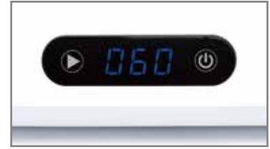
② 전원 코드를 연결하고 전원 버튼을 누르면 띵띠~ 소리와 함께 타이머 디스플레이에 60초 설정(기본)이 됩니다.