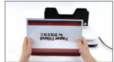
⑥ 가이드 레버를 당겨 제본물을 꺼내준 후 더욱더 밀착이 되도록 사진과 같이 2~3회 바닥에 툭툭 쳐줍니다.