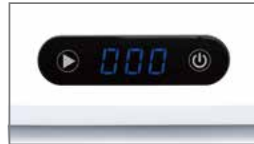
⑤ 제본이 완료되면 띵띠~ 알람음이 울립니다. (디스플레이에는 000이 표시됩니다)