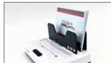
⑦ 제본물을 기기 뒤편 건조대에 넣고 약 3분간 건조해 줍니다.