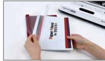
① 제본할 서류의 두께에 따라 적합한 표지를 선택 후 열표지 안에 원고를 넣어 준비합니다.